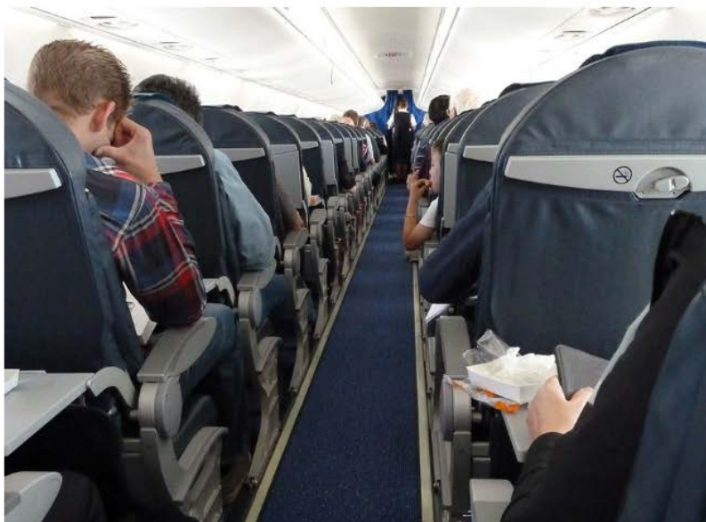
El proyecto pretende que los residuos de catering se separen en los propios aviones para su posterior tratamiento y valorización

El proyecto Life + Zero Cabin pretende recuperar el 80 por ciento de los residuos de catering que se generan en los aviones.