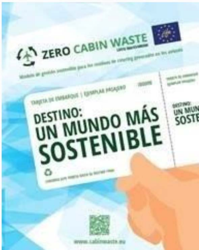
Iberia presenta Zero Cabin Waste | IBERIA