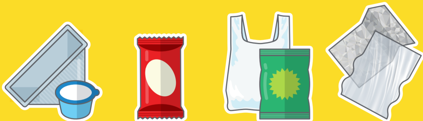
Envases de plástico Envoltorios de plástico Bolsas de plástico Envoltorios de aluminio y film