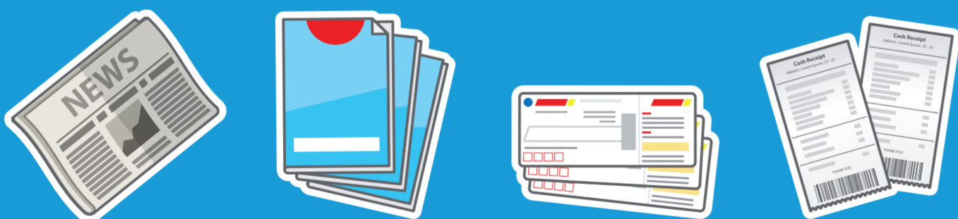
Periódicos Revistas Tarjetas de embarque Tickets