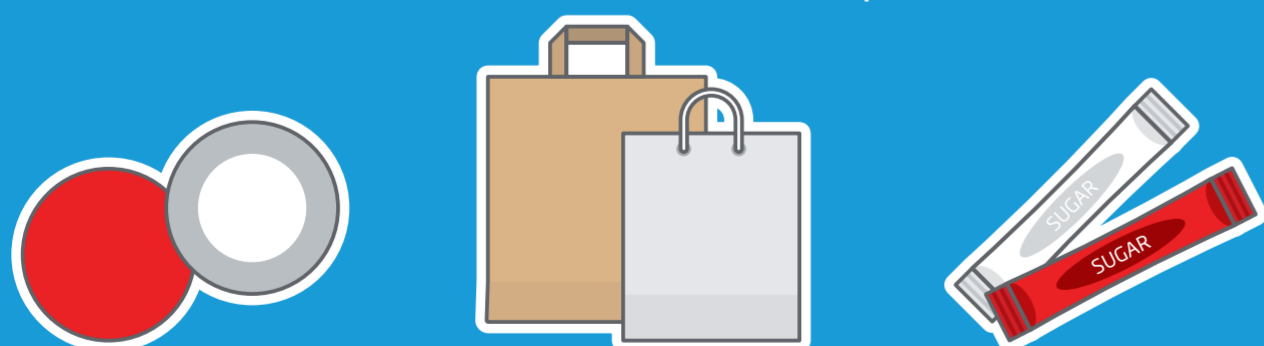
Posavasos Bolsas de papel Sobres de papel