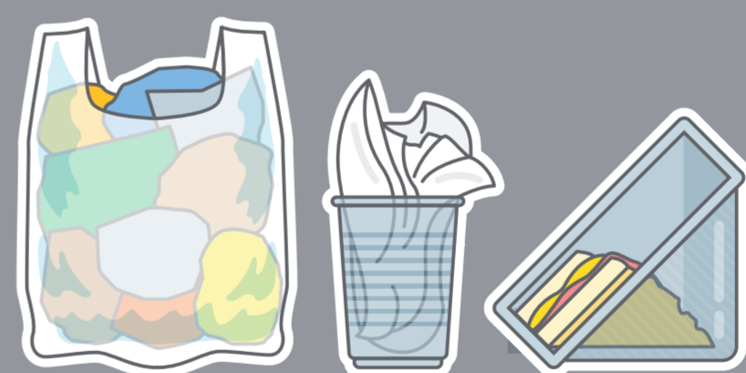
Mezclas de residuos

En caso de duda, tirar el residuo en este compartimento