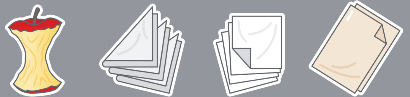
Restos de comida Empapadores Servilletas Mantel (sbp y cc)